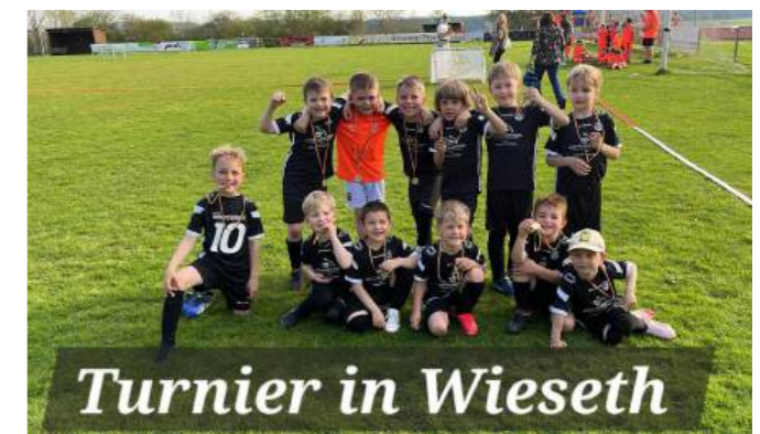
Turnier in Wieseth

Unsere E-Jugend ist nun unter den besten 6 von 93 teilnehmenden Mannschaften. Wir gratulieren allen Mannschaften zu diesen hervorragenden Leistungen, bleibt weiter am Ball und mit Spaß und Freude dabei.