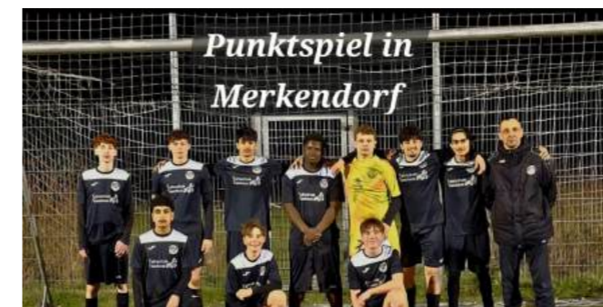
Punktspiel in Merkendorf