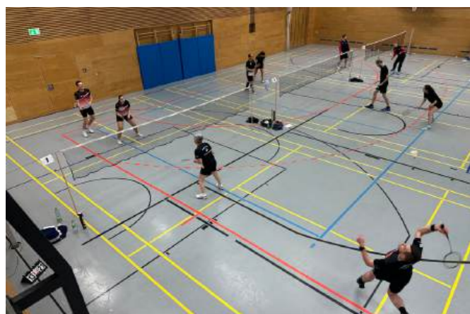
Hochkonzentriert und jederzeit bereit: Die Abteilung Badminton beim Turnier.